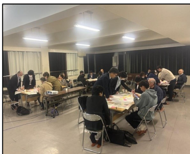
[ワークショップの様子]

* あくまでも、あらゆる可能性を探ることを目的としたもので、特定のアイデアや多く出されたアイデアなどを採用するということではありません。