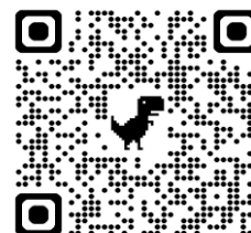
教育訓練給付制度対象 講座検索システム