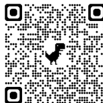
厚生労働省 HP 「教育訓練給付制度」