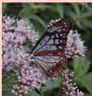
蝶の羽根にマーキング

秋には南下のアサギマダラの飛来地として食草の手入れをし、9月中旬から10月中旬まで毎日数百頭の飛来を観ることが出来る。全国のマキキ調査に参加して、その成果は大きな記録を更新している。一例は糠地で放蝶した個体が鹿児島県喜界島で2年続きで再捕獲された記録がある。