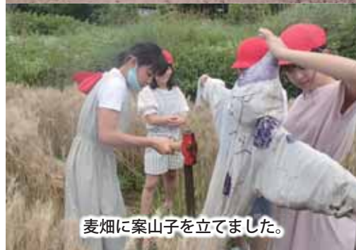
麦畑に案山子を立てました。