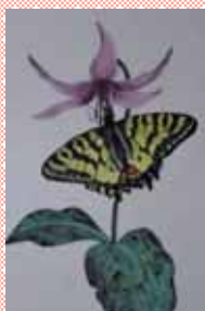
ヒメギフチョウ (絹本)