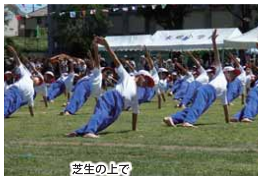
芝生の上で組体操をしました。

いつも校庭の芝生の手入れをしてくださっている先生に感謝しています。あと卒業までに芝生の校庭で何回体育や遊びができるか分からないから今のうちにたくさん遊びたいです。