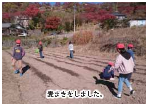
麦まきをしました。

これから私も、麦のように、どんどん成長して、中学校でも、がんばるようにしたいです。そして、その麦で、うどんを作りたいです。