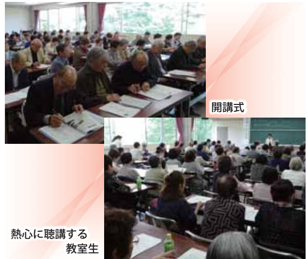
熱心に聴講する教室生

改めて運営内容を紹介しますと、公民館長を中心に高齢者クラブの役員として教室生の代表など20数名の運営委員が計画から実施まで担当します。5月から翌年1月まで13回の講座と春秋2回研修旅行(秋は一泊)を実施して