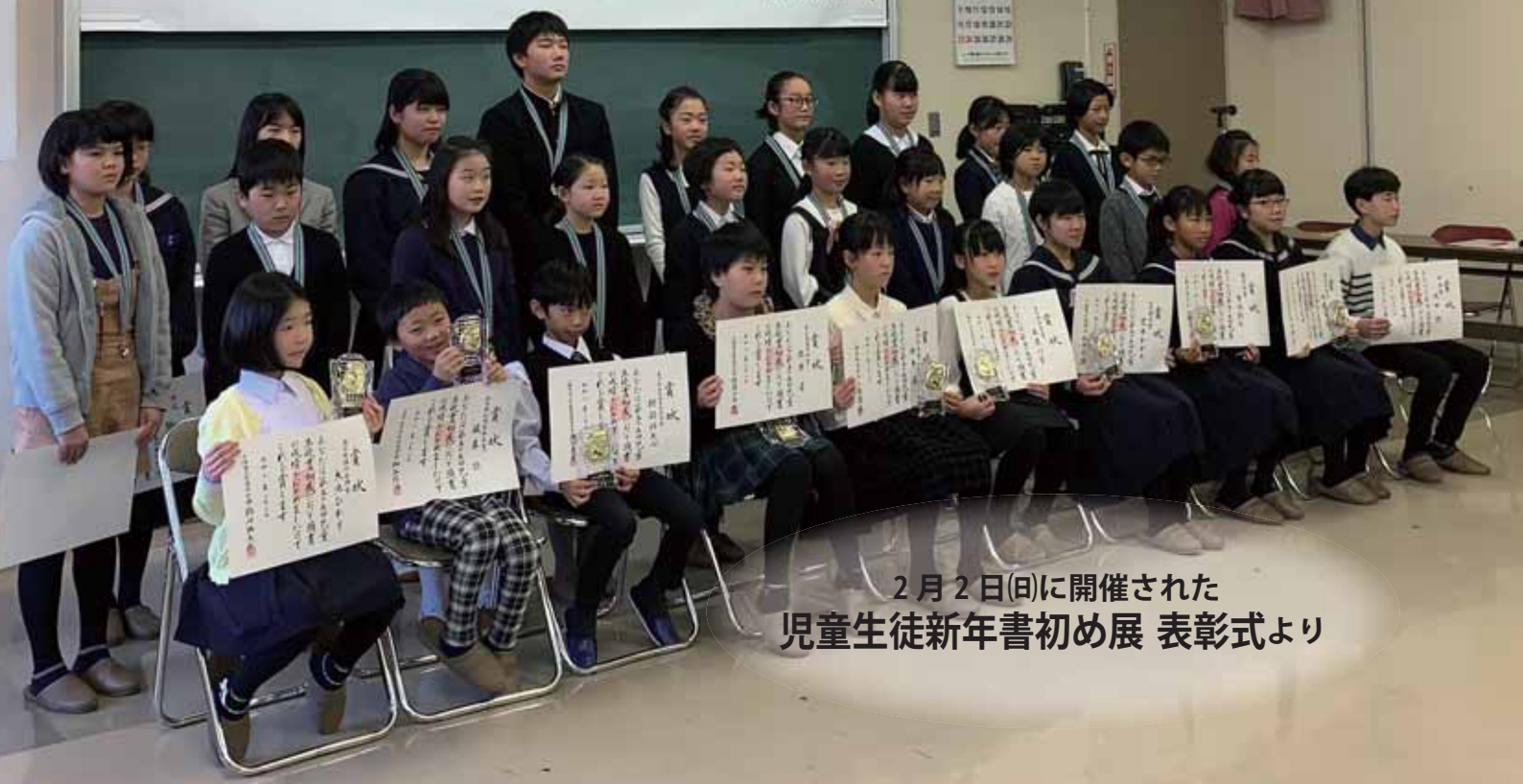
2月2日(日)に開催された 児童生徒新年書初め展 表彰式より