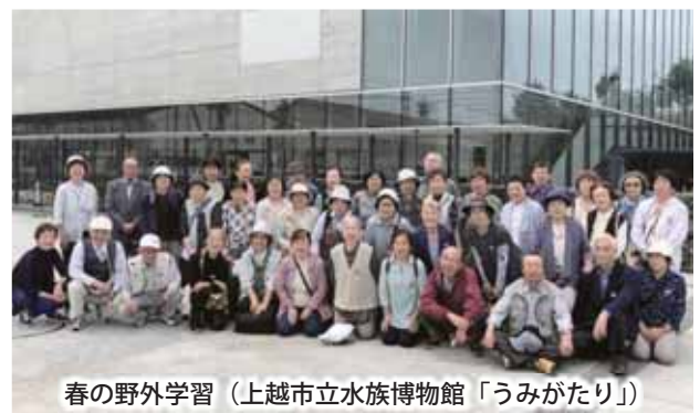
春の野外学習(上越市立水族博物館「うみがたり」)

います。運営委員の皆さんは全員が何らかの役目を担当し、このことが永続している秘訣であると思います。講座は多種多様で、やはり高齢者にとっては、声を出したり、体を動かしたり、笑ったり、歌ったりすることに人気があります。と同時に専門的な講座では皆さん目を輝かせて聞いています。