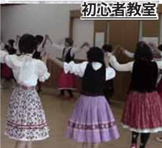
フォークダンス・レクリエーションダンスの初歩を学び、楽しく踊って心と身体の健康づくりを進めます。