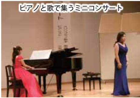
ピアノと歌で集うミニコンサート