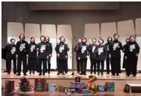
ゴスベルん♪こもろ

公民館報4月号でご案内しました7月17日(金)開講「小諸市民大学」、公民館報5月号でご案内しました7月3日(金)開講「こもろシニア教室」ですが、新型コロナウイルス感染拡大防止のため、今年度の開催を中止とさせていただきます。