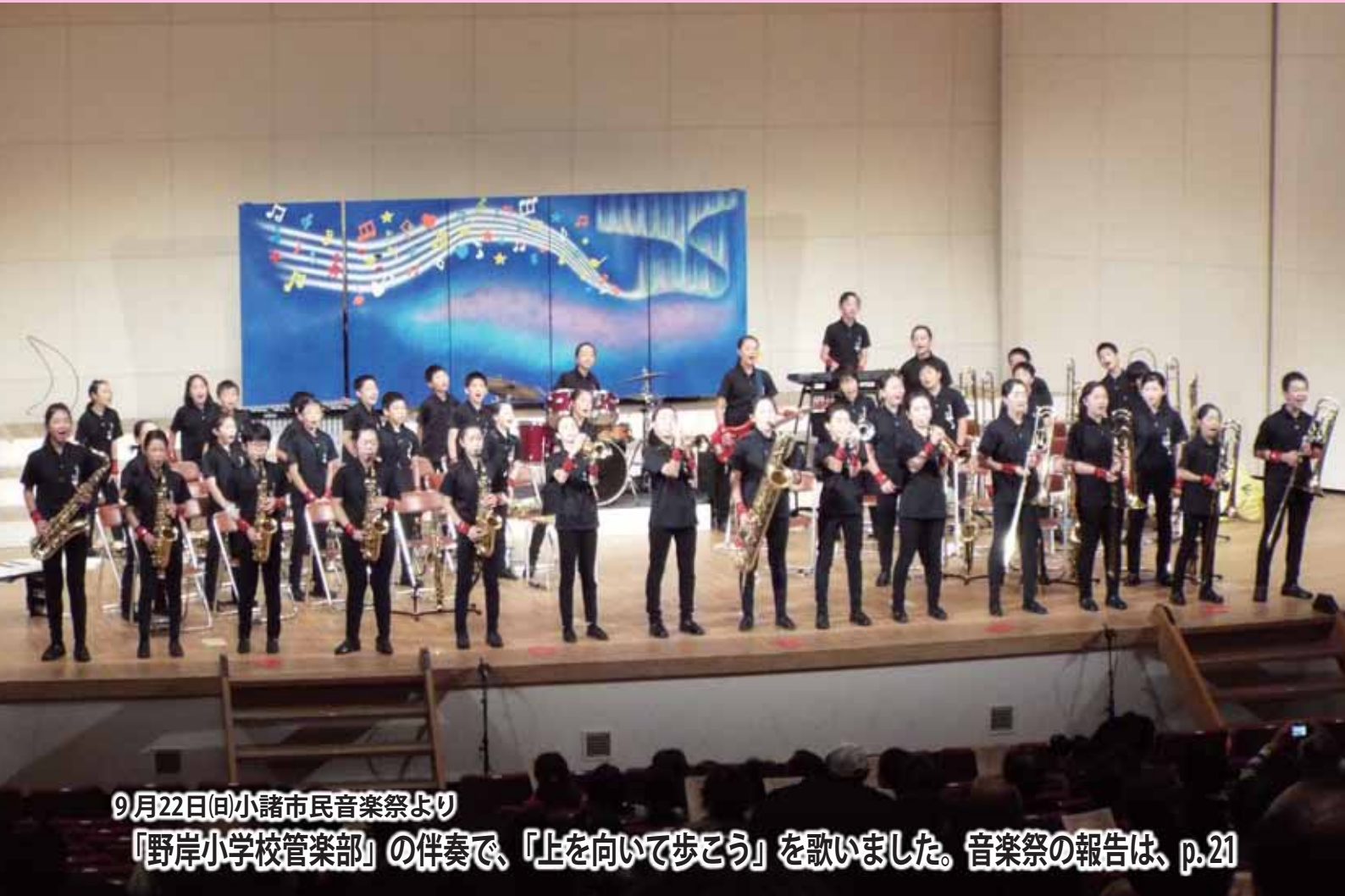
9月22日(日)小諸市民音楽祭より 『野岸小学校管楽部』の伴奏で、『上を向いて歩こう』を歌いました。音楽祭の報告は、p.21