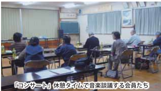
「コンサート」休憩タイムで音楽談議する会員たち