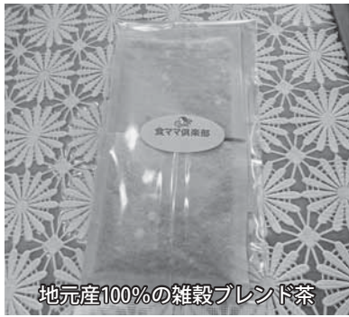
地元産100%の雑穀ブレンド茶

信条は、「やらない後悔より、やる後悔」。それゆえに、周りと衝突してしまうことも、そんな困難も、多くの人の助けで乗り越えてきました。「家族に本物の味を知ってもらいたい」と主婦として頑張る一方で、そういった食の