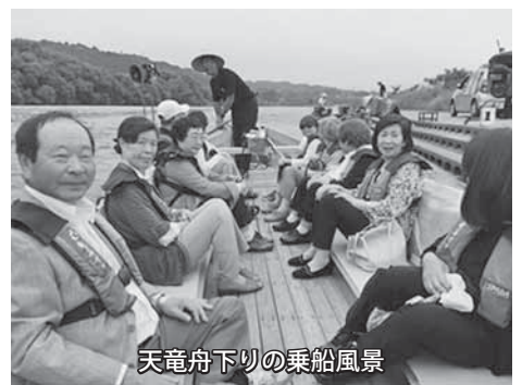
天竜舟下りの乗船風景

郎美術館です。川本喜八郎はNHK人形劇『三国志』などで多くのファンを魅了した人形美術家で、飯田はもともと江戸時代に上方の人形遣いを迎え入れて教えを請うた古の人々がいた縁があり『三国志』などの人形を川本喜八郎が寄贈する形で2007年に開館した人形美術館です。