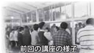
前回の講座の様子