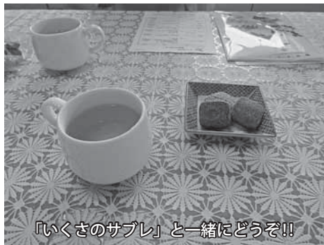
「いくさのサブレ」と一緒にどうぞ!!

最前線で仕事をしてきた経歴が、現在の高地さんを形作っているように感じます。いま最も力を注いでいるのが、毎月の「雑穀講座」。