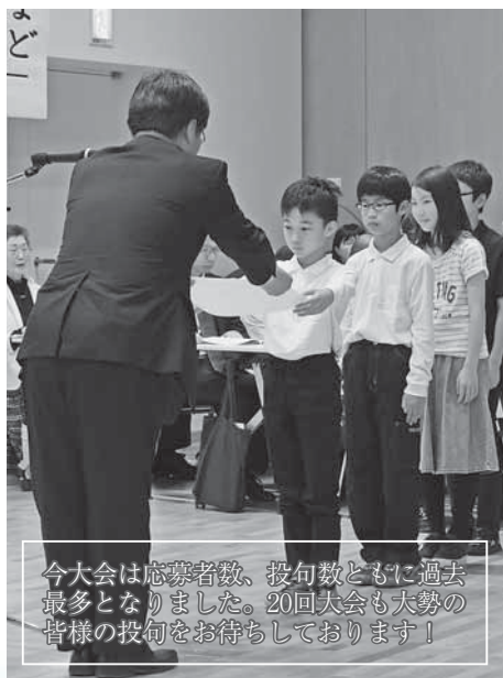
今大会は応募者数、投句数ともに過去最多となりました。20回大会も大勢の皆様のお待ちしております！