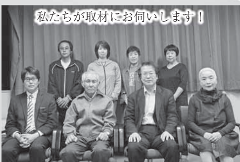
私たちが取材にお伺いします！