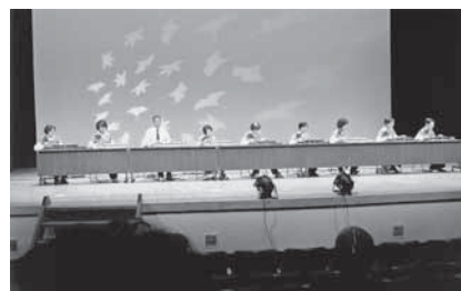
【さくらんぼ】(大正琴)