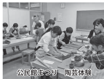
公民館まつり 陶芸体験

土の音は、60歳から80歳の17名の会員が和氣藹々（わきあたたか）と陶芸作品を作っています。