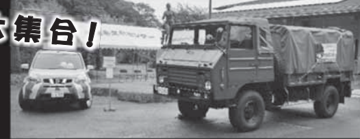
はたらくクルマ大集合!