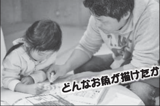
どんなお魚が描けたかな