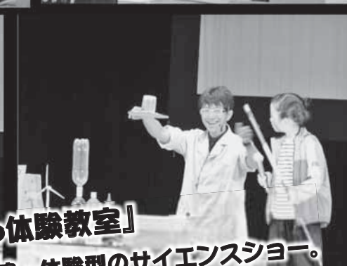
『らんま先生のeco体験教室』 今年も盛り上がった実演・体験型のサイエンスショー。 子どもだけではなく大人も楽しめたステージでした。