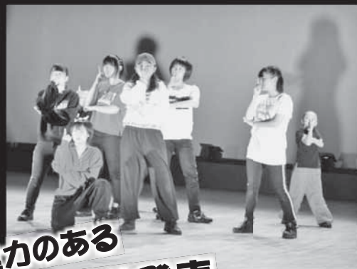
迫力のある ホール発表