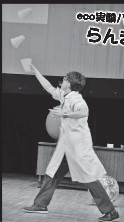
eco実験パフォーマンス らんま先生