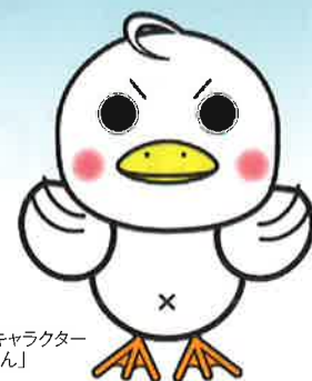
小諸市ごみ減量キャラクター 「減ちゃん」