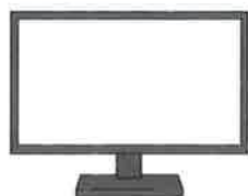
デスクトップパソコン