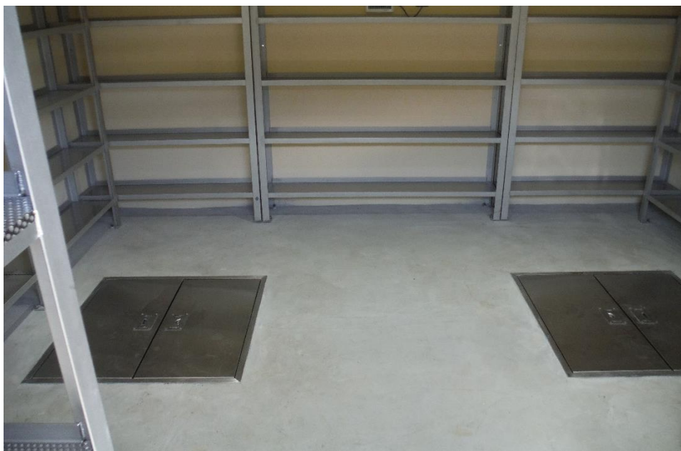
—合葬式聖地内部（個別埋蔵棚と共同埋蔵室）—