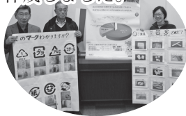
【作成した掲示物とアドバイザー①】

今年度（第1期の1年目）は、クリーンヒルこもろ管理棟2階の展示ホールに掲示する啓発資料を作成しました。