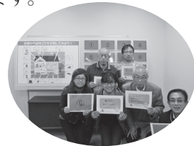
【作成した掲示物とアドバイザー②】