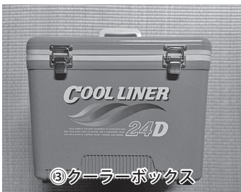
③クーラーボックス