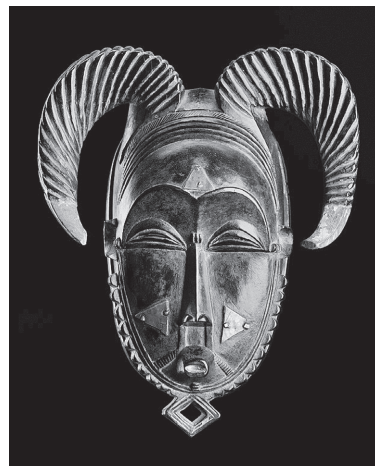
アフリカ・コートジボワールのマスク「トゥ・ボドゥ」