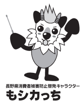
長野県消費生活センター 長野県キャラクター もシカっち