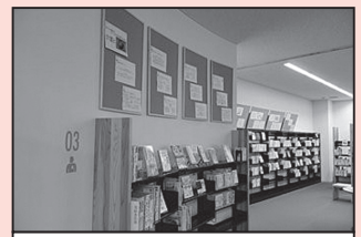
月替わりの企画展示 1月は「ストレス」がテーマ

🌸 こもろのひろば～1月の企画展示～ 🌸 小諸と“バンカゼリ”の不思議なつながりについて特集します。“バンカゼリ”ってご存知ですか？