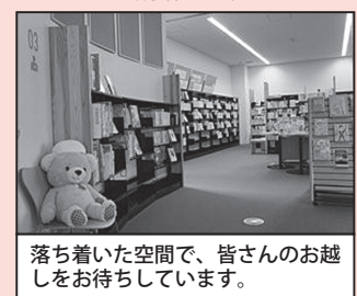
落ち着いた空間で、皆さんのお越しをお待ちしています。

誰もが、支える・支えられる立場にもなりうるのが、心や身体に関することです。そんな一人ひとりの“いきる”を支え、よりよい生活のための様々な情報をお届けするのが「こころとからだのひろば」です。館内に入り、正面を向いて左手に進んだ先にある落ち着いた場所に位置し、医療、看護、健康法、介護、高齢者医療、闘病記などの情報を集めています。