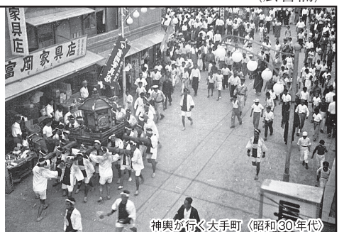
神輿が行く大手町(昭和30年代)

発行元：(株)いき出版 新潟県長岡市南七日町 81-5 TEL0258-89-6555