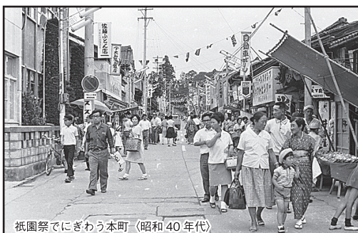
祇園祭でにぎわう本町(昭和40年代)