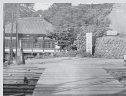
線路を横断する三之門への道