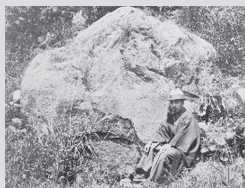
運ばれる前の藤村詩碑の原石