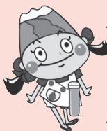
基本計画PRキャラクター「山野めぐみちゃん」