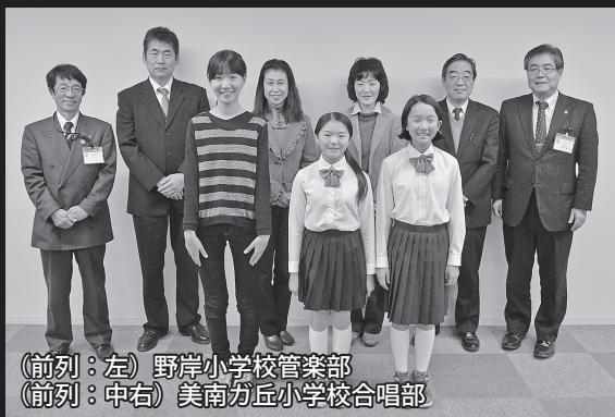
(前列：左) 野岸小学校管楽部 (前列：中右) 美南ガ丘小学校合唱部

「こども音楽コンクール東日本大会選考会」において、野岸小学校管楽部および美南ガ丘小学校合唱部が「第52回かんてんぱば・SBCこども音楽コンクール」地区大会出場49団体の中から東日本Bブロック優秀演奏発表会に出場する19団体に選ばれました。