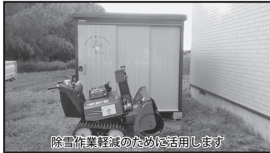
除雪作業軽減のために活用します

(一財)自治総合センターが所管する宝くじの社会貢献広報事業である「コミュニティ助成事業」を活用し、公民館に掲示板と除雪機を整備しました。