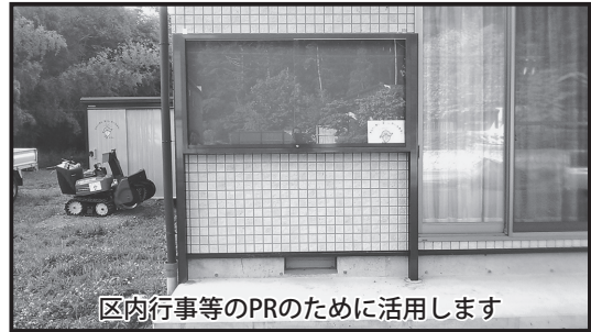
区内行事等のPRのために活用します