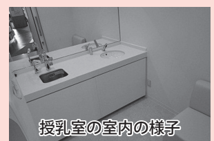
授乳室の室内の様子

育児や離乳食、子どもの病気に関する本に加え、妊娠・出産や絵本に関する雑誌もこちらに揃えています。