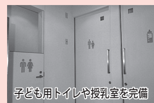
子どもトイレや授乳室を完備

読み聞かせの優しい声、子どもたちの笑顔、小諸図書館の館内で一番賑やかなエリアが“すみれのひろば”です。こちらは、絵本や児童向けの読みものを揃え、本に触れ、親しみ、読書を楽しむ子どもを育む場所です。また、子育てに関する本や雑誌も揃えています。保護者同士の情報交換や交流の場としてもご利用いただけます。