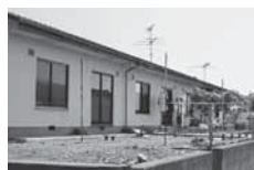
富士見平団地 (富士見平区) 平屋建