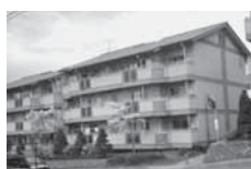
中松井団地 (東雲区) 3階建