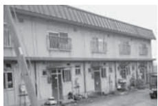
囃団地 (東雲区) 2階建 メゾネット式