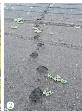
クマとの遭遇を防ぐためには、日頃からの注意と対策がとても大切です。農地や山林で行動する際、日常生活での注意点、さらにクマと遭遇してしまったときの対処法を以下にまとめました。クマの目撃情報や、足跡・フンなどの痕跡を見つけたら、小諸市役所農林課までご連絡ください。クマによる被害を最小限にとどめるべく、皆様お一人おひとりのご理解とご協力をお願いします。