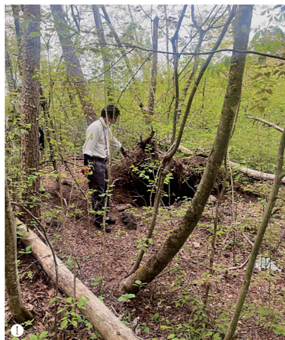
【写真】①クマの冬眠穴。②畑に残るクマの足跡。③シカ用のわなに誤ってかかってしまったクマ(2才)。