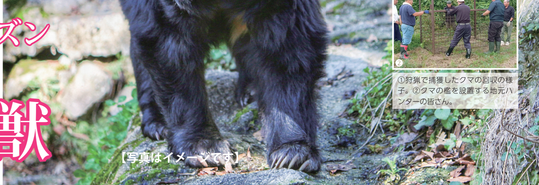
【写真はイメージです】