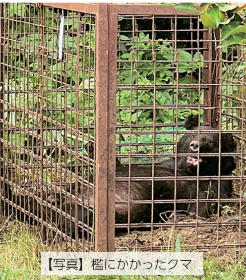
【写真】檻にかかったクマ