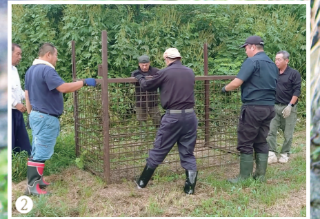
①狩猟で捕獲したクマの回収の様子。②クマの檻を設置する地元ハンターの皆さん。