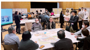
3グループに分かれて話し合いました