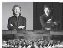
大友直人 水野優也 東京フィルハーモニー交響楽団