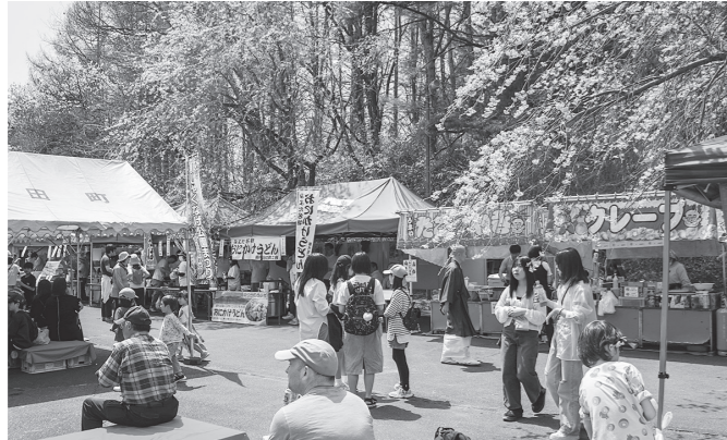
御代田町観光協会事務局(産業経済課 商工観光係内) ☎ 32-3113

御代田町では、しゃくなげの開花時期にあわせて、「浅間しゃくなげ公園まつり」を開催します。