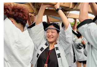
▲市民まつり みこしでは南町連に参加させていただきました。

現在は移住希望者に向けた窓口相談やツアーなどを行っています。食べることに吞むことが大好きで、小諸の美味しい食材やお酒にもうメロメロです…! まちで見かけたら気軽に声をかけてください ☺