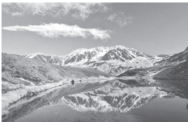
「立山好日」(北アルプス 立山室堂)

軽井沢町在住の山岳写真家・松井勝男氏の写真50点余りから浅間山や北アルプスなどの県内各地の壮大な山岳容姿を紹介します。雄大な山々の美しさや自然の厳しい姿などをぜひこの機会にご覧ください。