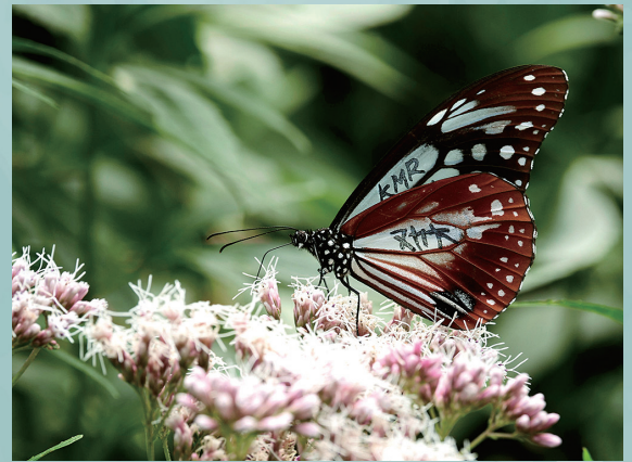
小諸でマーキングされたアサギマダラにはKMRと書かれている

小諸市の保護条例で指定された蝶は2種。6月号で紹介したアサマシジミと、今回取り上げるアサギマダラだ。アサマシジミは本当に絶滅に瀕している蝶だが、アサギマダラは保護の甲斐あり、増えている蝶だ。どうしてアサギマダラが指定されたかといえば、糠地でアサギマダラの調査をやっておられる方がいて、糠地がアサギマダラの里として全国的に名前が知られているからだ。マーキングと言って ほね 翅に特定の番号を書いて放しているのだが、2022年には9月30日に糠地でマーキングされたアサギマダラが12日後に岐阜県で再捕獲され、その個体がさらに24日後に奄美諸島の喜界島で捕獲された。さらに9月26日にマーキングされた別の個体が40日かけて喜界島まで飛んだことがわかっている。糠地から喜界島までは直線距離で1,190km以上もある。喜界島では2023年にも小諸から移動した蝶が捕獲されている、自分でマークした蝶がこんなに遠くまで飛んでいくなで、ロマンのある話だと思う。