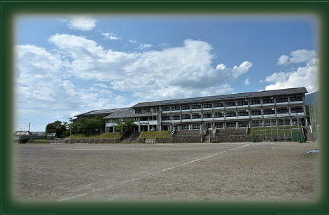
図 学校教育課 再編整備係