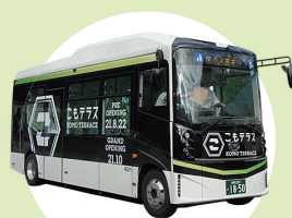
環境に配慮した EV バス