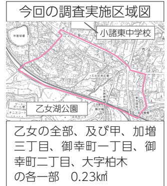
今回の調査実施区域図