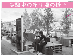
実験中の座り場の様子