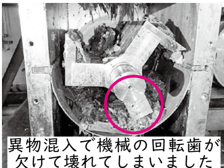
異物混入で機械の回転歯が欠けて壊れてしまいました