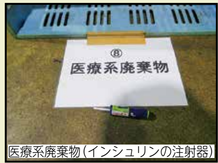
医療系廃棄物 (インシュリンの注射器)