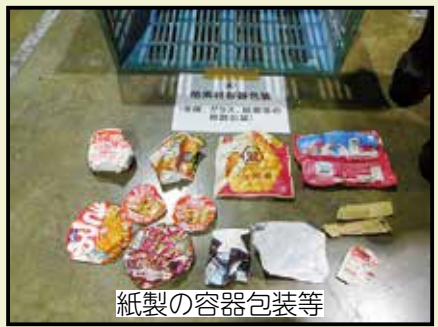
紙製の容器包装等