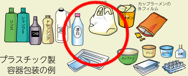
プラスチック製容器包装の例

汚れているプラスチック製容器包装は、リサイクルできないんだよ。どうしても汚れが取れない場合は、燃やすごみ指定袋（赤色）に入れて、燃やすごみとして排出してね。また、二重袋にして排出しないように協力してね。