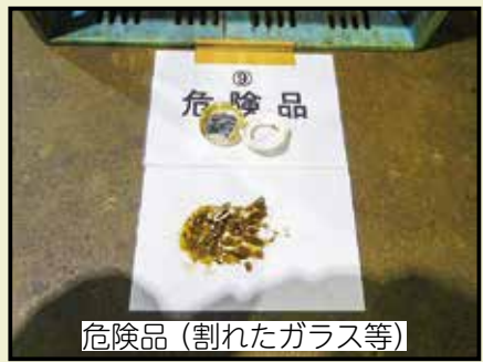
危険品 (割れたガラス等)