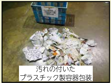
汚れの付いたプラスチック製容器包装

みんなに分別して出してもらっているプラスチック製容器包装が適切にリサイクルされるように、「プラスチック製容器包装の適切な排出方法」についてお知らせするね。