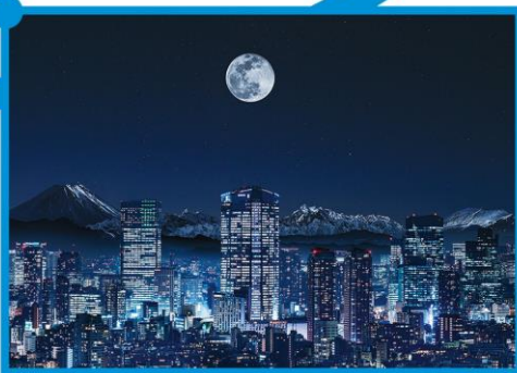
Midnight in a Perfect World - 2020