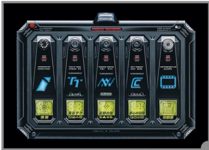
The Phokus Archives - 2015