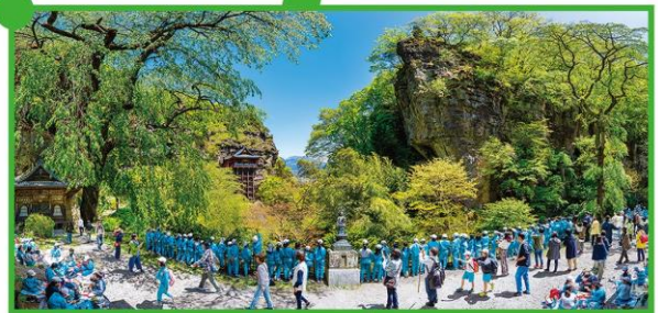
遠足(布引観音) - 2023