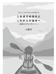
小諸市のエンディングノート (青色が目印)