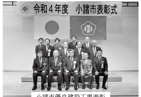
小諸市優良建設工事表彰