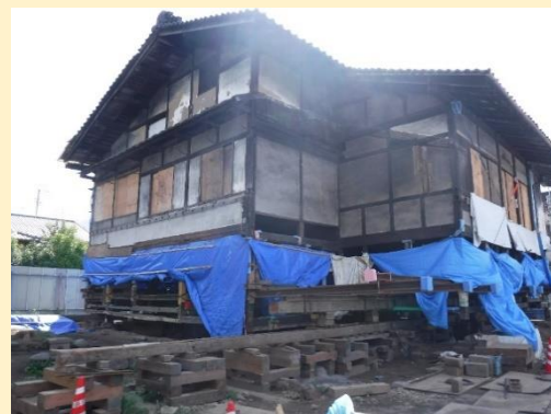
上：準備中の工事現場 左：曳家工事の概要図