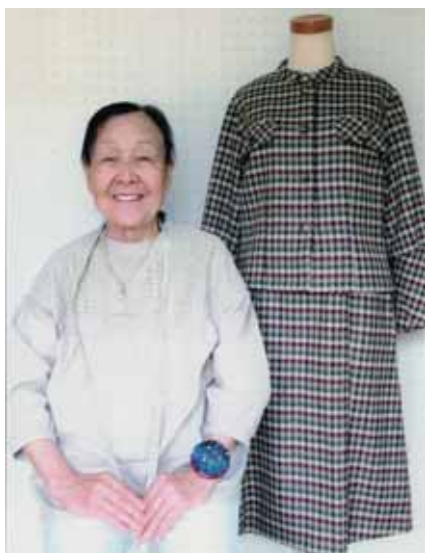
生地不足を補い仕上げたスーツ

それからというものの、お客様からの色々なリクエストに応えてきました。裾丈の直しから始まって、着物の帯をばらして新しい服に仕立て直したり、チャイナドレスやウエディングドレスの注文もありました。また、重い障がいを持つたお子さんのために着脱しやすいツナギ服も作りまし