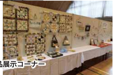
作品展示コーナー