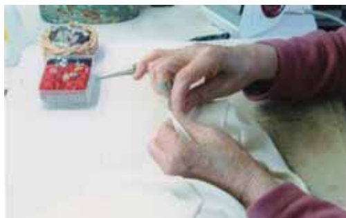
ほどいて、ぬって……大切な私の手

た。このような障がい児を抱える親御さん同士の口づてで、わざわざ千曲市や、遠くは千葉県から注文が入つたこともあります。 振り返ってみれば、生業とはいえ、我ながら飽きずによくやつてこれたなと思います。