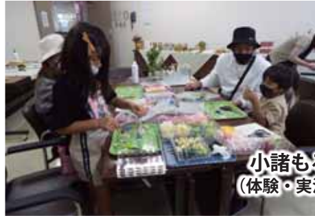
小諸もろもろ塾 (体験・実演コーナー)

第37回公民館まつりを10月8日・9日に開催します。昨年とは3年ぶりに開催することができ、多くの方に参加していただきました。今年も下記のとおり『小諸もろもろ塾』として、体験・実演をしてくださる方及び『展示作品』を募集します。