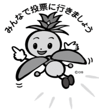
長野県選挙啓発マスコットキャラクター ほたりちゃん