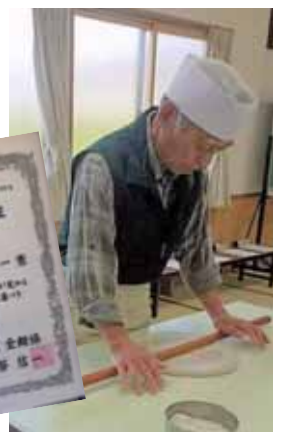
蕎麦の出来栄え、美味しさは打ち手の

の技量はもちろん大切ですが、一番は蕎麦粉の品質が左右します。20年以上にわたり蕎麦打ちを続けていますが、粉の種類や状態、気温、湿度等の条件がその都度違うため、打つたびに違う蕎麦になり、何度打っても満足いく蕎麦打ちには難しく、毎回挑戦です。