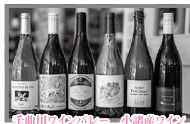
千曲川ワインバレー 小諸産ワイン 飲み比べ6本セット (白・ロゼ)