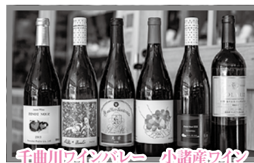
千曲川ワインバレー 小諸産ワイン 飲み比べ6本セット (赤)