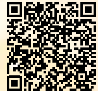
小諸市のワクチン接種に関する最新情報はこちら