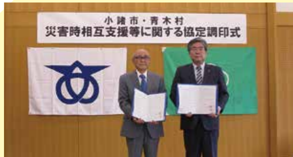
災害時相互支援等に関する協定調印式 (青木村保健センター)