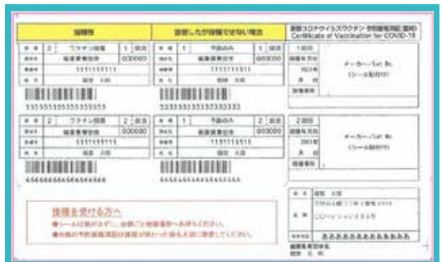
新型コロナワクチン接種券のイメージ (7月中旬に送付済)

小諸市では、7月中旬に、市内に住民票のある16～64歳の方へ新型コロナワクチンの接種券を送付しました（12～15歳の方の接種券は後日送付予定です）。今後のワクチン接種の進め方の概要につきましては、下記のとおりとなります。