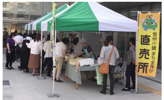
(過去開催時の様子)