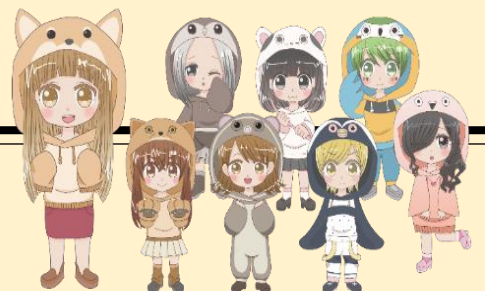
小諸市動物園キャラクター